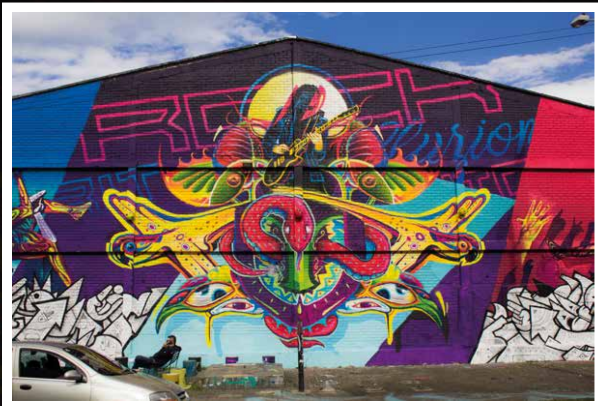
Rastrem - Bulkar - Shagu