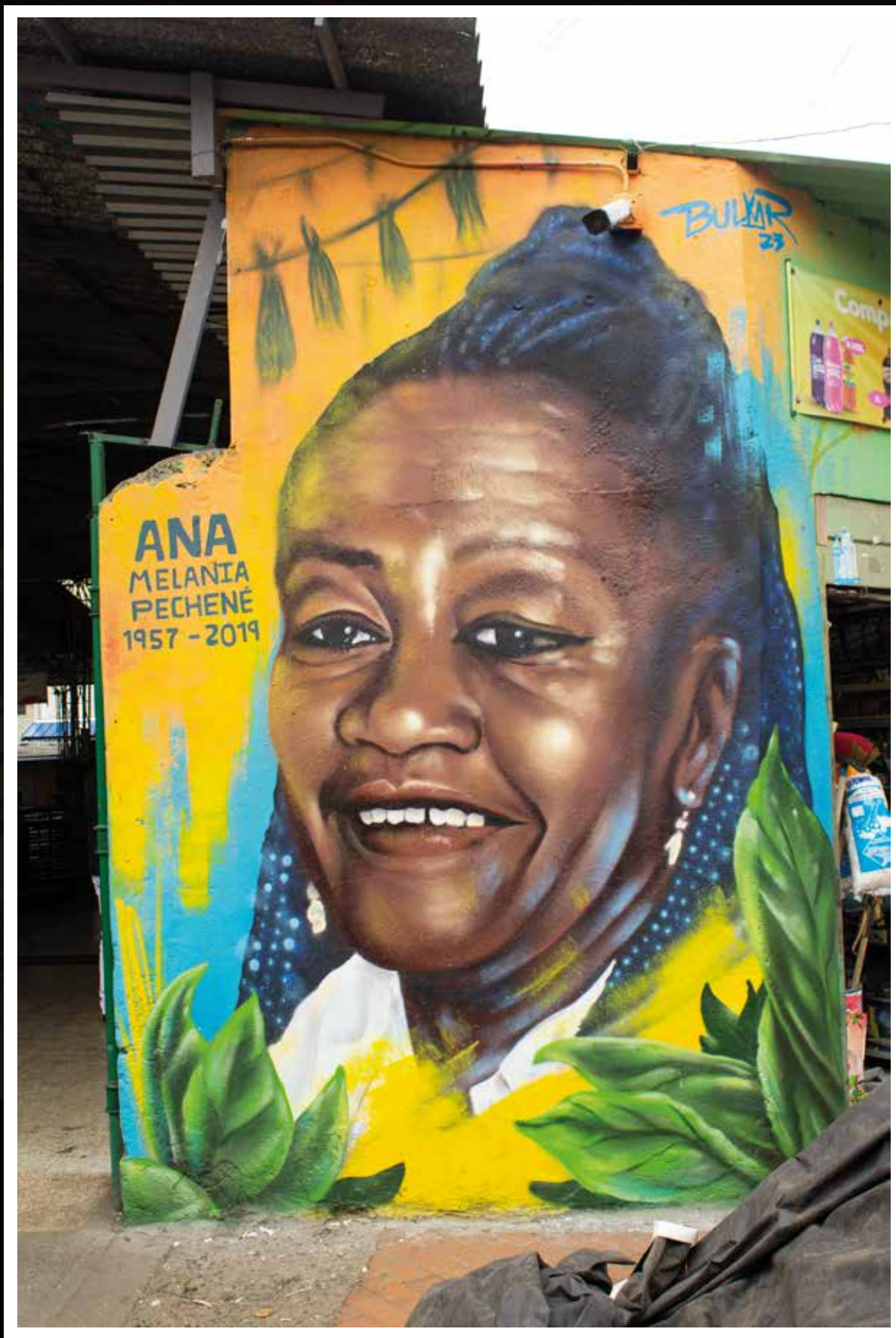
Mural pequeño formato, Plaza de las hierbas, Samper Mendoza