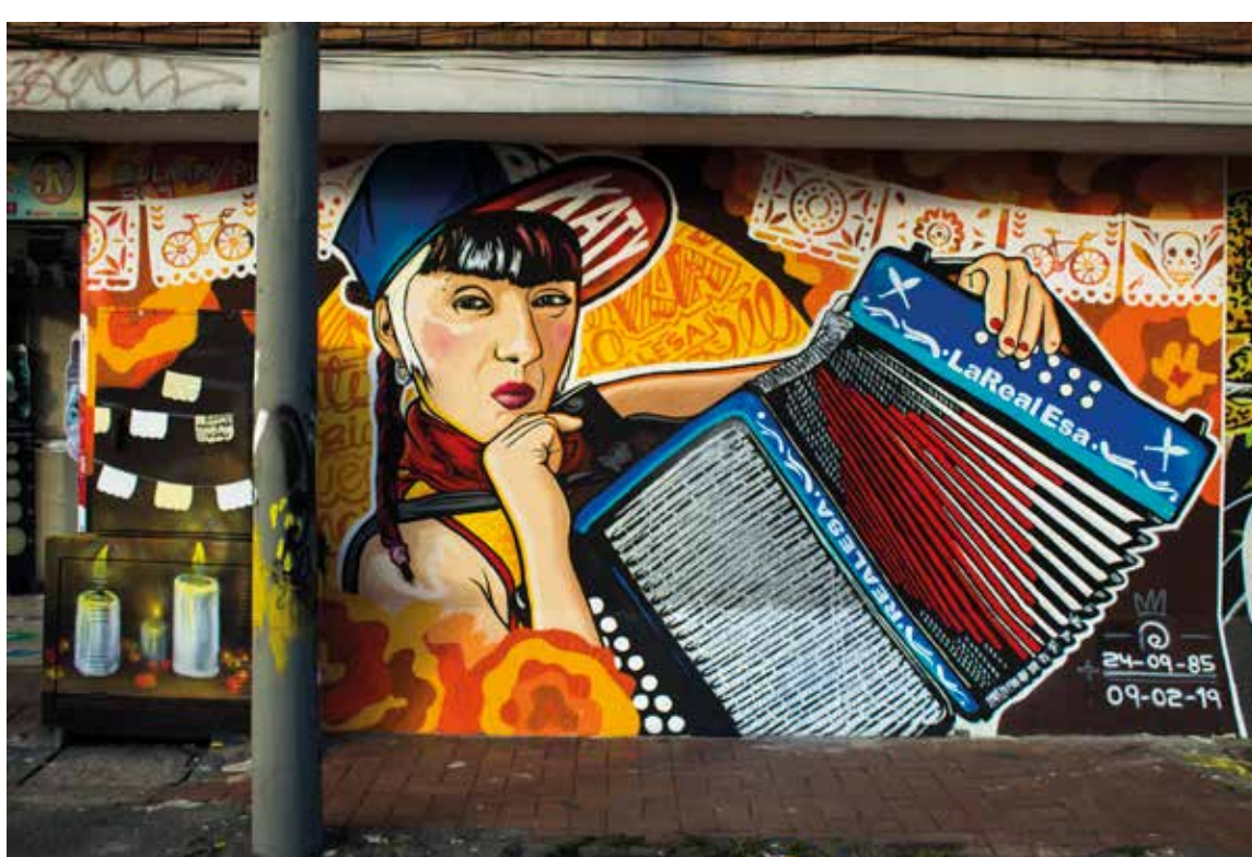
Mural pequeño formato, Homenaje a La Realesa, 2019